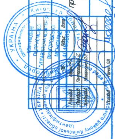
Схема прибудовання прибудинкової території вул. Дніпровська, 5