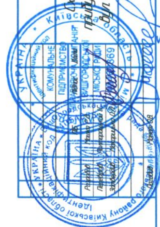
Схема прибудинкової території: буд. Хмельницького, 1