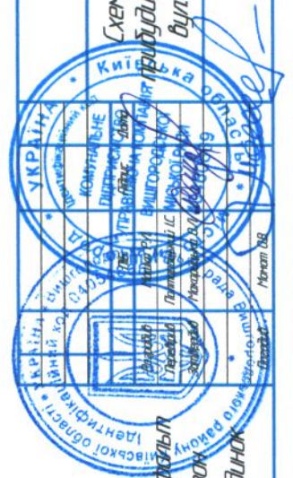
Схема прибудинкової території вул. Київська, 18